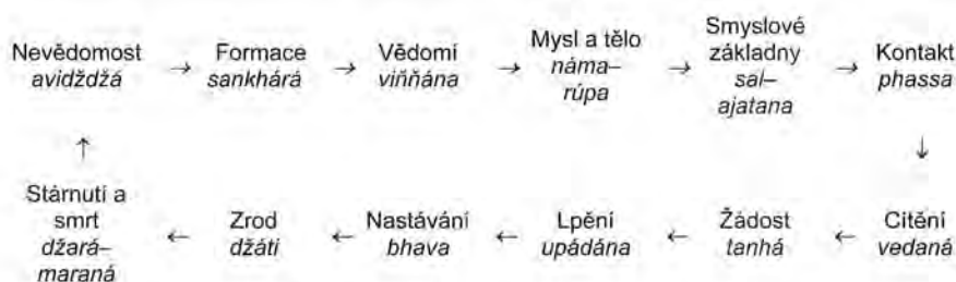
Diagram 1. Matice podmíněného vznikání

1) Nevědomost ( avidžžá ) nebo jinak řečeno absence vhledu do povahy vlastních